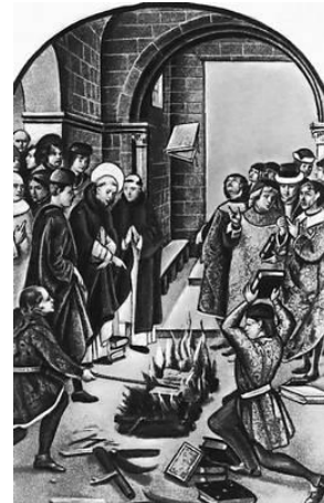
Nr.4. Raamatute põletamine.