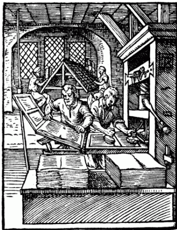
Nr. 3. Esimene trükipress