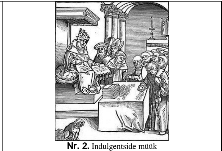
Nr. 2. Indulgentside müük